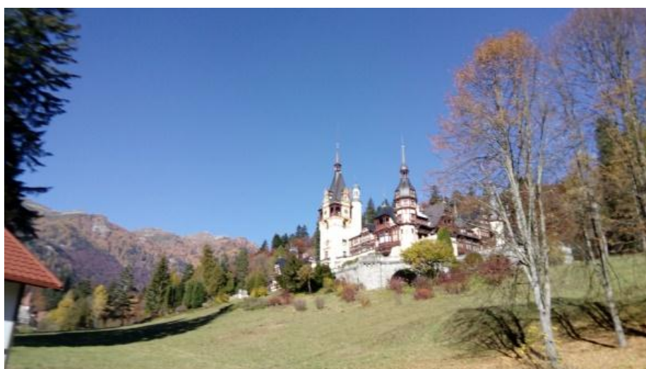
Pałac Peles, Sinaia